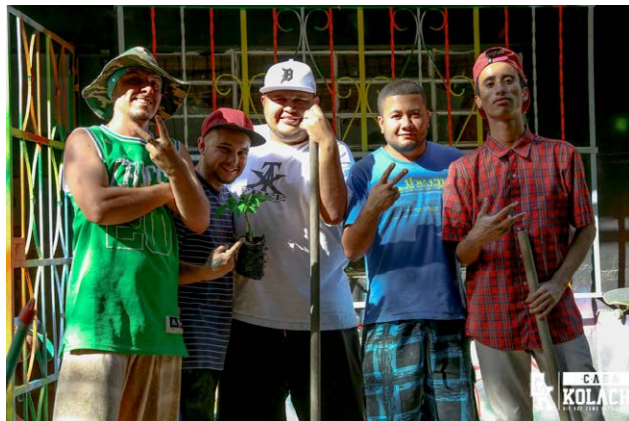
Integrants de la Casa Kolacho.