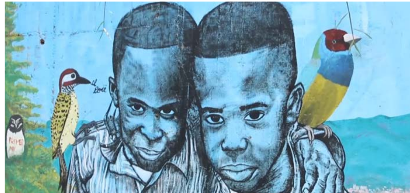
Fotografia: grafiti en un fotograma del reportatge “C13 Territorio de artistas” / Meloan.

Pel que fa a l’àmbit social, el context dels nostres barris ha estat complex en molts sentits. D’una banda, ens trobem amb una manca de recursos econòmics a l’hora de dur a terme els nostres somnis. De l’altra, la violència també ha