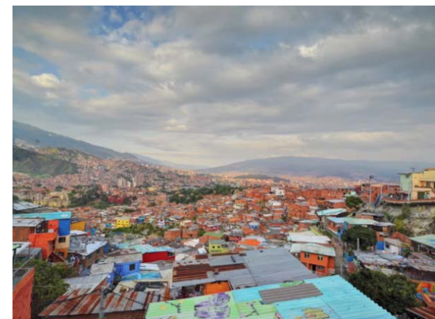
La Comuna 13.

La Comuna 13, situada a la perifèria oest de la ciutat, era un dels territoris on la violència es manifestava amb intensitat. Quan hi va arribar, el hip-hop hi va trobar el terreny abonat. D'entrada, va seduir els més joves amb l'estil consumista venut per la cadena nord-americana MTV, associat a grans cotxes, mansions i molts diners. Però aquesta aproximació superficial aviat passaria a convertir-se en un ferm compromís de transformació social.