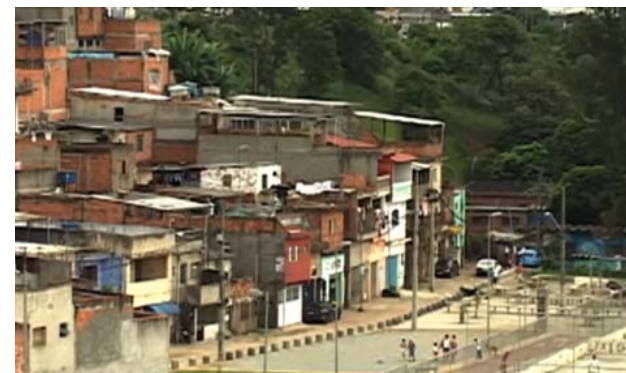
Fragment d’un vídeo del CEDECA de Sapopemba.