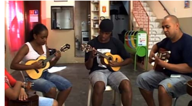
Fragment d'un vídeo del CEDECA de Sapopemba.

ció professional, l'absència d'oportunitats perquè els joves de les favelas es preparin per al món laboral. I pel que fa a la seguretat, denunciem la violència policial: execucions sumàries, destrucció de documents personals per part de la policia, tortures, etc. La situació és tan greu que fins i tot els polítics conservadors ja admeten el genocidi contra la joventut negra i pobra del país.