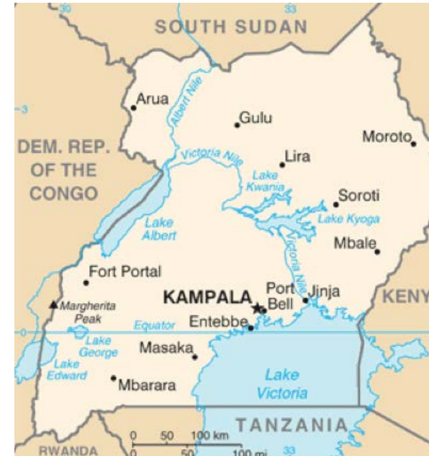
Font: University of Texas, Austin.

Aquell mateix any, va esclatar al nord d'Uganda un conflicte armat que enfrontava diversos grups rebels contra l'exèrcit ugandès. En poc temps, Joseph Kony va emergir com a líder indiscutible d'aquestes milícies, i va acabar agrupant-les sota les sigles de l'Exèrcit de Resistència del Senyor (LRA).