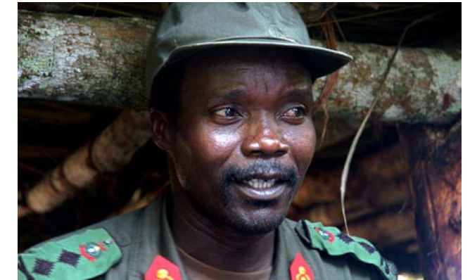
Joseph Kony, líder de l'LRA.

L'LRA acumula una història sanguinària i brutal. És responsable de milers d'assassinats, segrestos, violacions, mutilacions i saquejos. Un dels aspectes més foscos de la seva