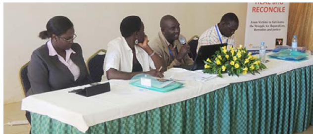
Alguns participants en una trobada sobre justícia transicional impulsada per AYINET.

El nord d'Uganda viu ara una situació de relativa calma, i són nombroses les ONG que actuen sobre el territori. No obstant això, les ferides obertes durant les dues dècades de conflicte són profundes. La recuperació avança, però queda encara un bon tros de camí per recórrer.