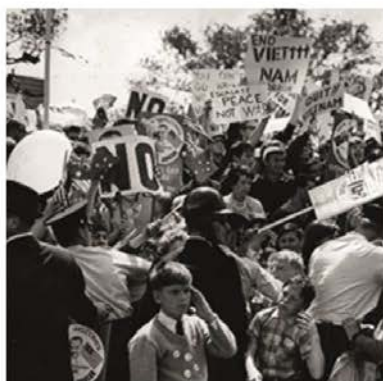
Manifestacions contra la guerra de Vietnam (1964) (EUA)