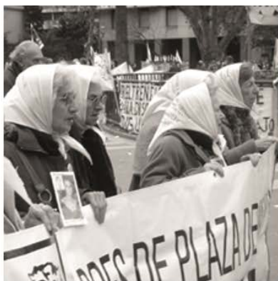
Mares a la Plaza de Mayo (1977) (Argentina)