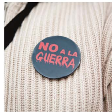
"No a la guerra" (2003)

② Amplia la informació sobre algun d'aquests moviments, seguint l'esquema següent: