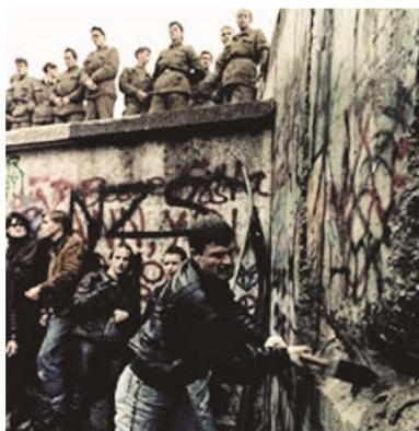
"La Tardor de les nacions" Caiguda del mur de Berlín (1989)