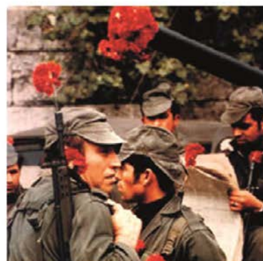
Revolució dels Clavells (1974) (Portugal)