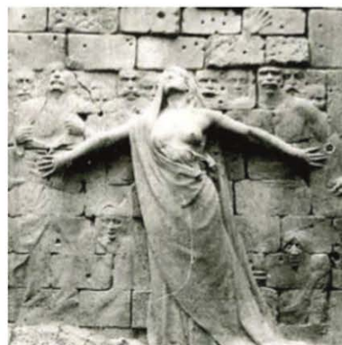
Comuna de París (1871)