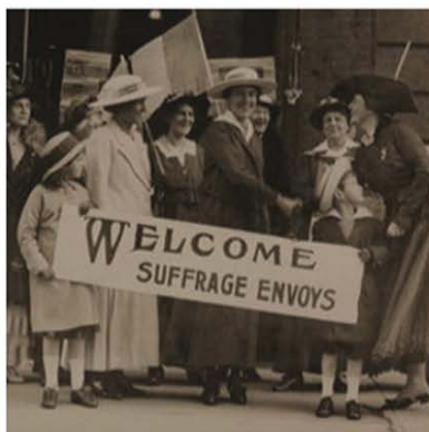
Manifestacions sufragistes. Declaració de Seneca Falls (1848)