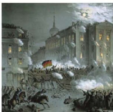
"La primavera dels pobles" Revolucions de 1848