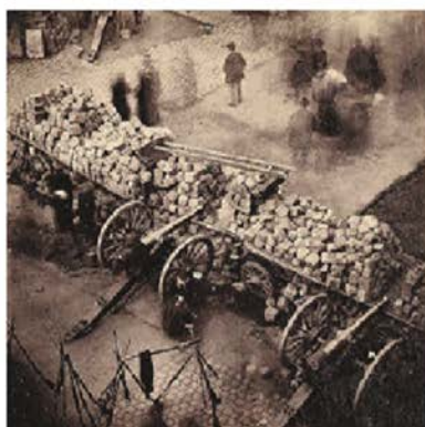
Vaga de la Canadenca (Barcelona) (1919)