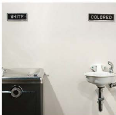
Boicot contra els autobusos. Martin Luther King (1955) (EUA)