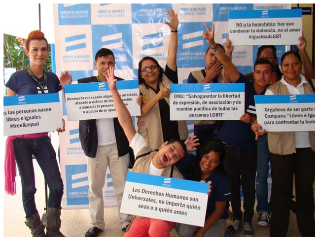
Membres d'APUVIMEH, donant suport al llançament de la campanya "Lliures i iguals", de les Nacions Unides.

Les persones infectades pel VIH són sovint estigmatitzades i pateixen diverses discriminacions, que de vegades també afecten les seves famílies. L'accés a la feina, l'educació i l'atenció sanitària són algunes de les dificultats amb què es troben.