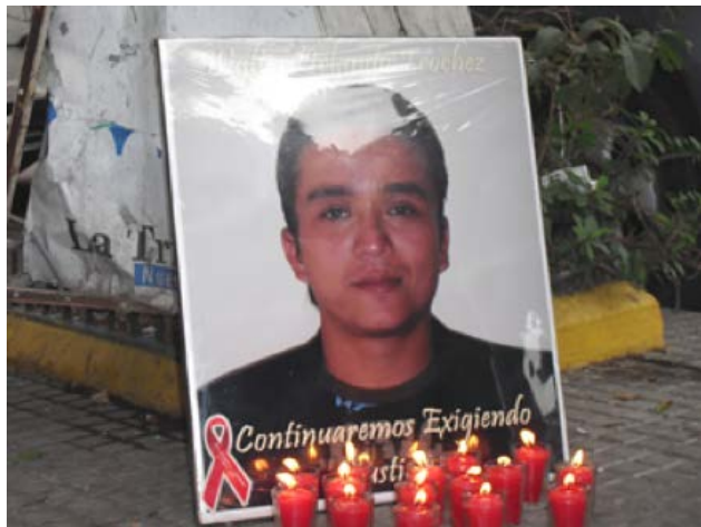
Acte en memòria de Walter Trochez.

*Comissió Interamericana de Drets Humans. Violencia contra personas lesbianas, gay, bisexuales, trans e intersex en América. 2015.