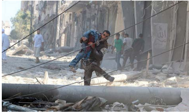
Un home carrega una persona ferida a Alep.

tenir un cert pes en l'àmbit regional o internacional.” Vidal feia aquesta afirmació quan es commemoraven cinc anys de l'inici de la guerra a Síria. Segons l'Agència de les Nacions Unides per als Refugiats (ACNUR), el conflicte havia generat aleshores 6,6 milions de desplaçats interns; 4,8 milions de persones s'havien refugiat en països veïns. Al maig, l'Observatori Sirí dels Drets Humans va presentar dades actualitzades sobre el nombre de víctimes mortals provocades per la guerra: se superaven ja les 280.000.